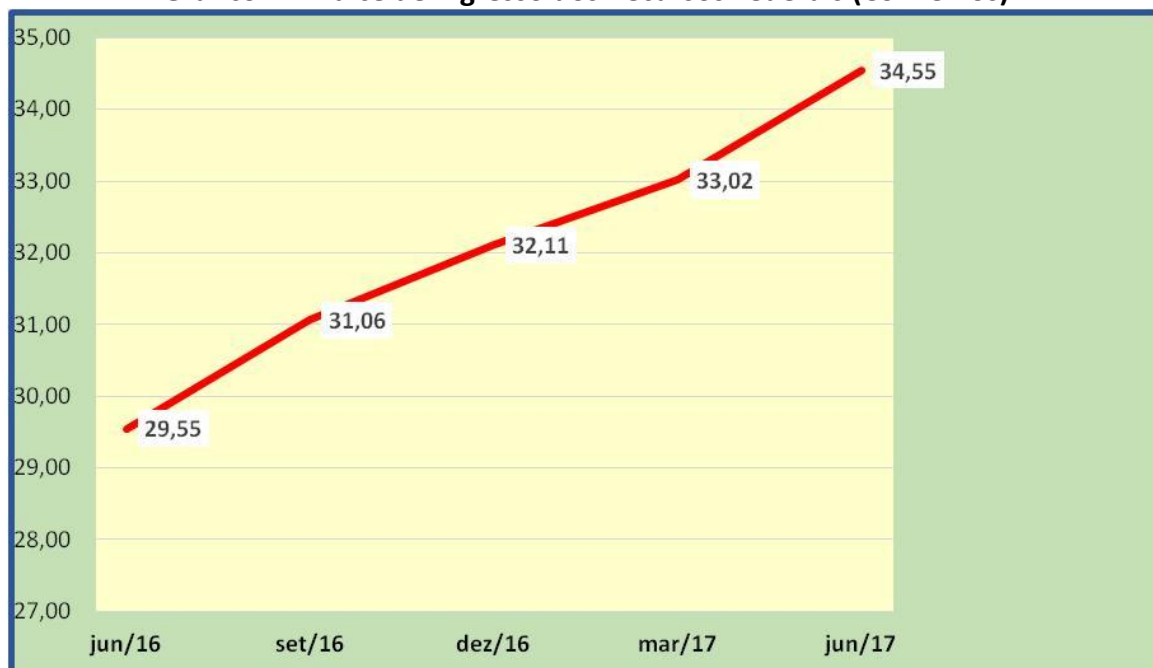
Gráfico 1 - Índice de Ingresso dos Recursos Federais (Convênios)

Pode-se afirmar que, em meio a dificuldades, o Estado do Rio Grande do Sul continua mantendo uma boa execução desses convênios e busca aperfeiçoá-la.